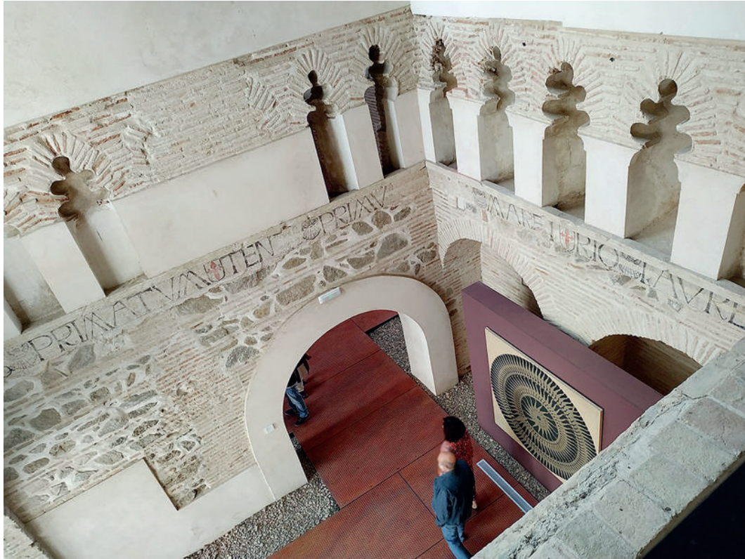
Vue de l'intérieur du couvent Santa Fe à Tolède.