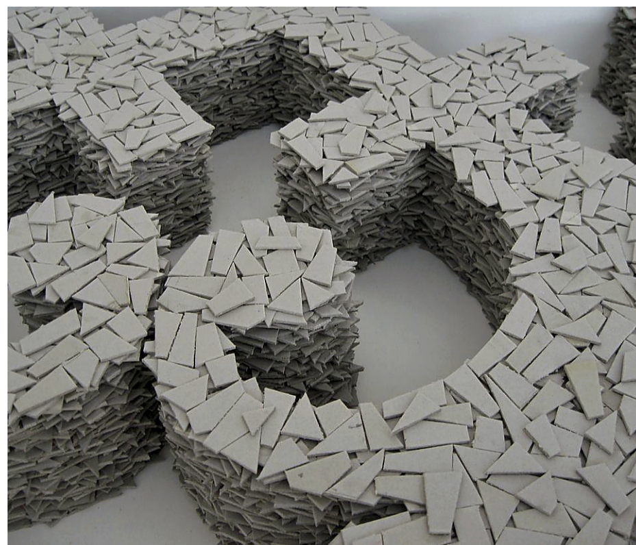
Recreación de la obra, realizada en muro seco de un metro de altura.