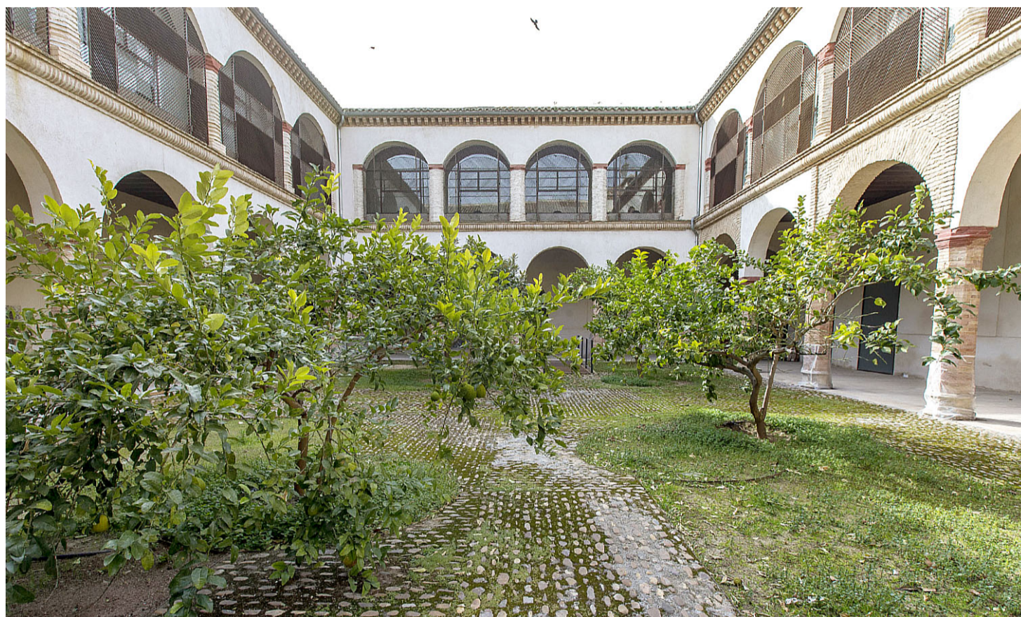
La obra se instalará de forma permanente en el patio de CORPO, en el antiguo claustro del convento de Santa Fe.